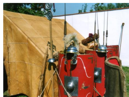
Papilio (tent) en wapenuitrusting van contubernium (Romeins manschap)