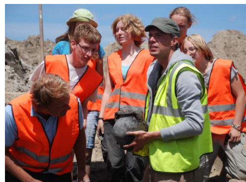
Veldwerk in Oegstgeest 2009