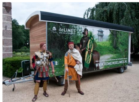
Exterieur Mobilimes Foto LimesWiki