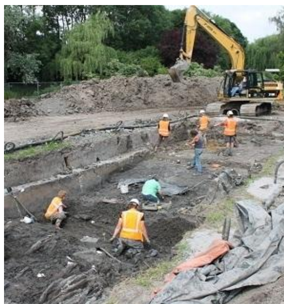
Opgraving De Plantage Leiderdorp 2013