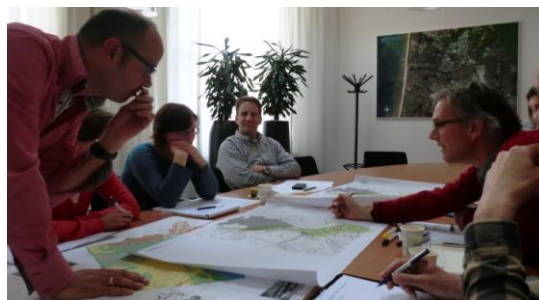
Projectteam Masterplan Romeinen in Katwijk