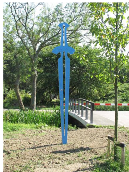
Beeld van Germaans zwaard