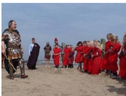
Romeinenweek 2012, Katwijk