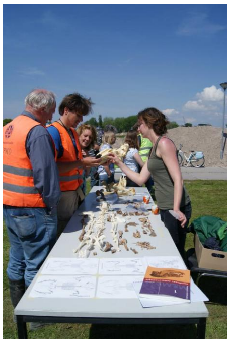
Publieksdag, Oegstgeest 2013