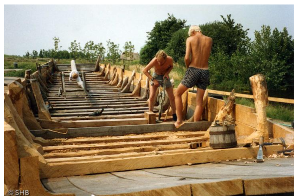
De replica van de Zwammerdam 6 in aanbouw.