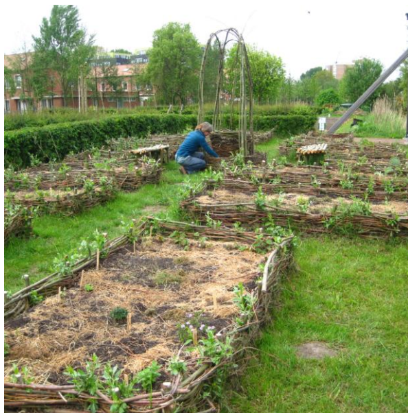
Aanleg Romeinse tuinen in Park Matilo

PRAE en Stichting Salix werken in Park Matilo in Leiden samen aan een Romeinse kruidentuin. Met hulp van vrijwilligers en leerlingen van het Wellant College zijn er verhoogde bakken gevlochten, bankjes getimmerd, tuinaarde gekruid en de eerste planten geplant. In de tuin zijn bedden voor keukenkruiden, geneeskrachtige kruiden, bijenplanten, parfumkruiden en decoratieve bloemen. Er worden uitsluitend kruiden aangeplant die de Romeinen gebruikten, maar die ook nu nog hun nut (en schoonheid) bewijzen. De Romeinse tuin ligt naast de rode loods aan de Besjeslaan en is vrij toegankelijk voor bezoekers. Enthousiaste mensen die willen helpen met het onderhoud van de tuin zijn welkom! Voor meer informatie kunt u terecht op www.prae.biz en stichtingsalix.nl