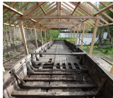
De Zwammerdam 6