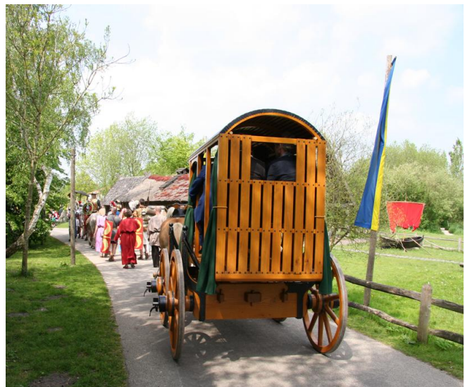
Intocht Archeon